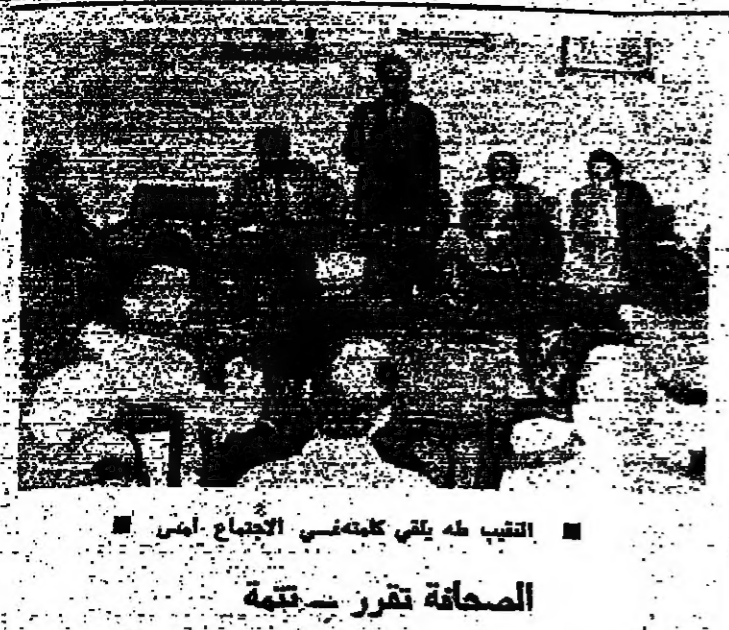
التعب يطغى على كعضوية الاجتماع أمس

المصفاة تقرر ستمته يلجأون والحقبة الوطنية. إن يكونوا قوة المواطنين المسؤولين. وصورة صحة للتراث العلمي الواسع السليم